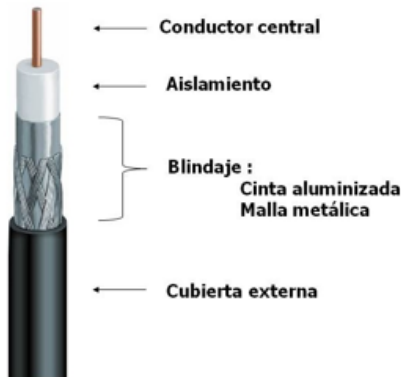
Componentes de un Cable Coaxial