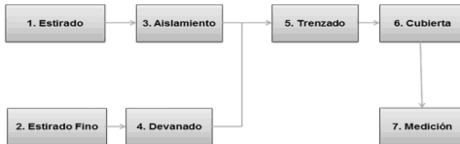
Diagrama del proceso de producción de cable coaxial