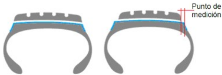
Figura 1. Punto de medición