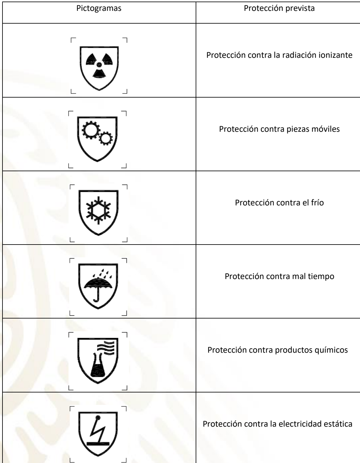
Tabla 1 – Pictogramas (ISO 13688:2013)