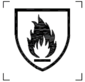
Figura A1 – para tela de protección contra calor y flama NMX-A-029-INNTEX-2010

Abajo del pictograma debe llevar la designación de la norma específica ya sea Norma Mexicana o ISO correspondiente. Ejemplo: