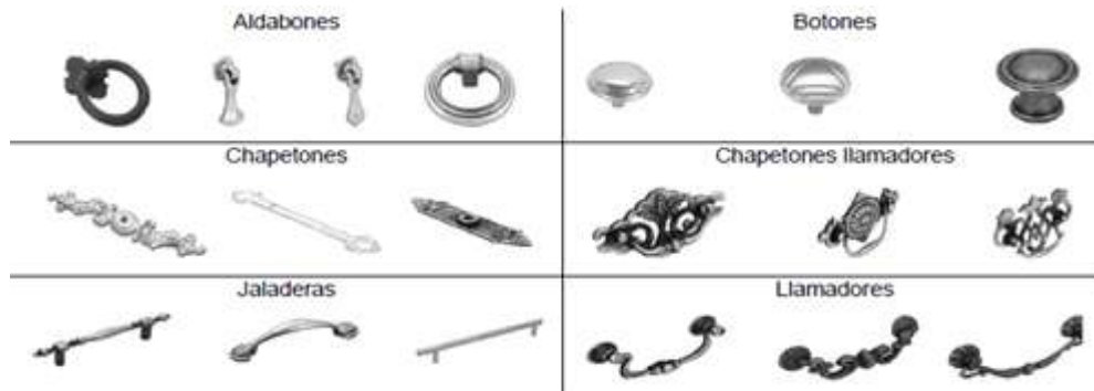
Ilustración 2. Jaladeras de zamac

9. Los tipos de jaladeras de zamac incluidos en la investigación son estrictamente jaladeras, botones, chapetones llamadores, llamadores, chapetones y aldabones, como los que se ejemplifican en la Ilustración 2.